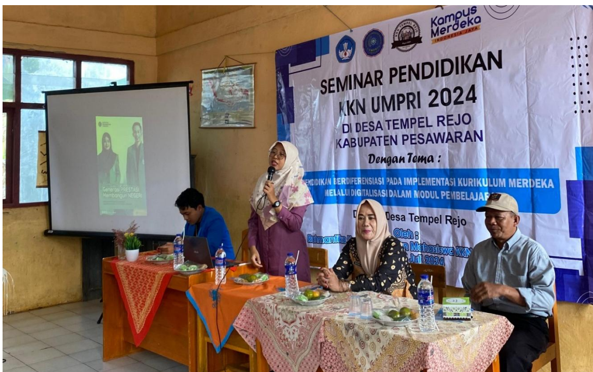
Gambar 2: Kegiatan Pemaparan PKM tentang Pembelajaran Berdiferensiasi

Pada tahap ini, pelaksana PKM mulai menjelaskan tentang pembelajaran berdiferensiasi sesuai dengan materi yang disusun oleh Dosen dan TIM PKM KKN. Materi mengadaptasi dari materi guru penggerak oleh Balai Guru Penggerak Provinsi Lampung. Dalam pemaparan ini, tim pelaksana menjelaskan tentang latar belakang atau alasan kenapa guru harus mengetahui tentang gaya dan minat belajar siswa dalam upaya mengoptimalkan proses pembelajaran di kelas. Kemudian pemaparan dilanjutkan dengan menjelaskan konsep tentang pembelajaran berdiferensiasi kepada guru diselingi dengan tanya jawab. Dilanjut dengan pemberian materi tentang pembelajaran