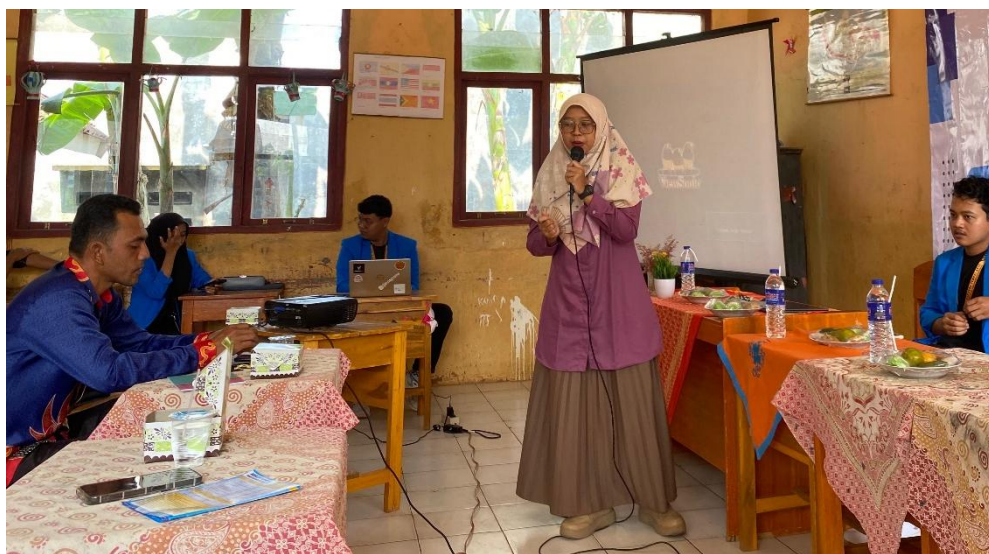
Gambar 3: Kegiatan Refleksi terhadap penyampaian hasil PKM

Pada kegiatan ini dilakukan refleksi bersama terhadap kegiatan PKM dari awal kegiatan sampai dengan akhir kegiatan. Kegiatan refleksi dilakukan dengan melakukan tanya jawab berdasarkan pertanyaan pemantik. Setelah kegiatan refleksi, selanjutnya kegiatan PKM ditutup dengan doa bersama.