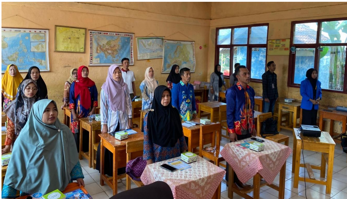
Gambar 1: Kegiatan Pembukaan PKM