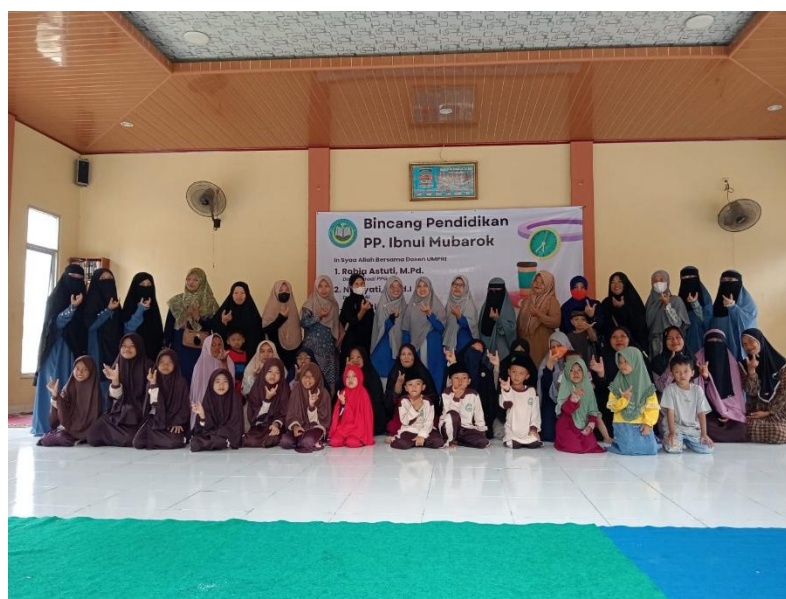
Gambar 3. Foto Bersama Tim PKM, dewan guru, peserta PKM dan peserta didik