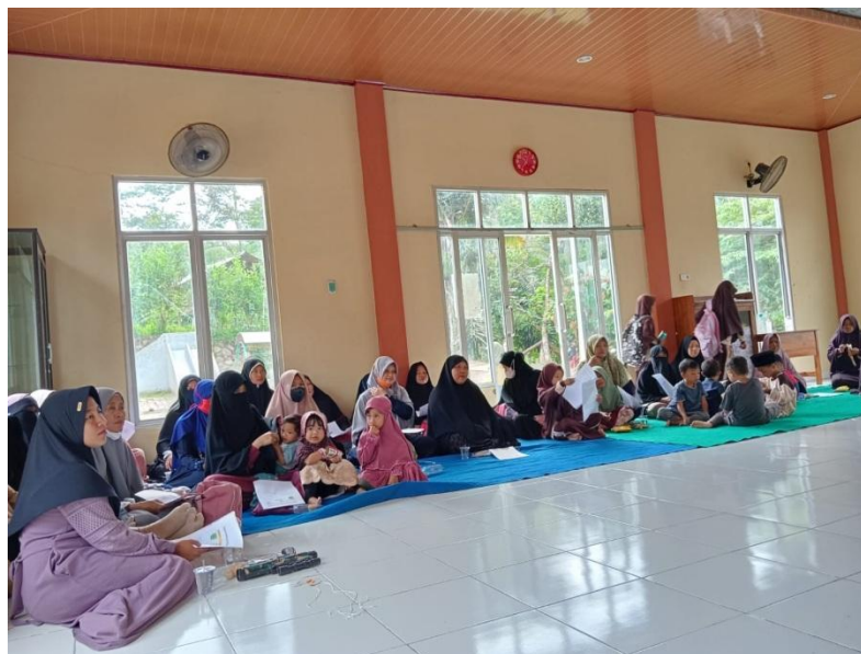
Gambar 3. Peserta PKM sedang menyimak pemaparan pemateri