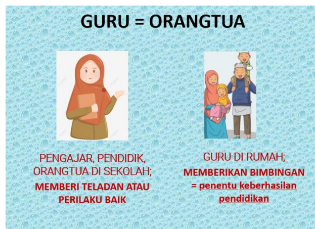
Gambar 1. Peran Guru dan Orangtua untuk Pembentukan Insan Cendekia

Sinergi antara orangtua dan PKBM memiliki pengaruh positif untuk membentuk insan cendekia. Keterlibatan orang tua dalam pendidikan anak memiliki dampak positif terhadap perkembangan akademis, sosial, dan pembentukan karakter anak.[6]