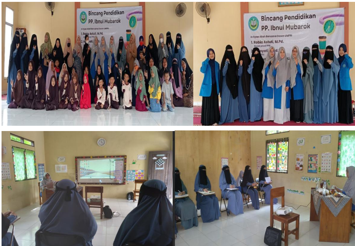
Gambar 1. Kegiatan pembukaan dan seminar